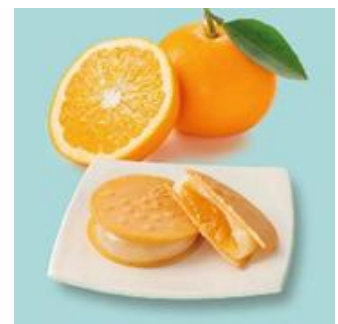
厚生労働大臣賞を受賞した （株）にしき堂（広島県）・瀬戸内 の八潮せとこまち